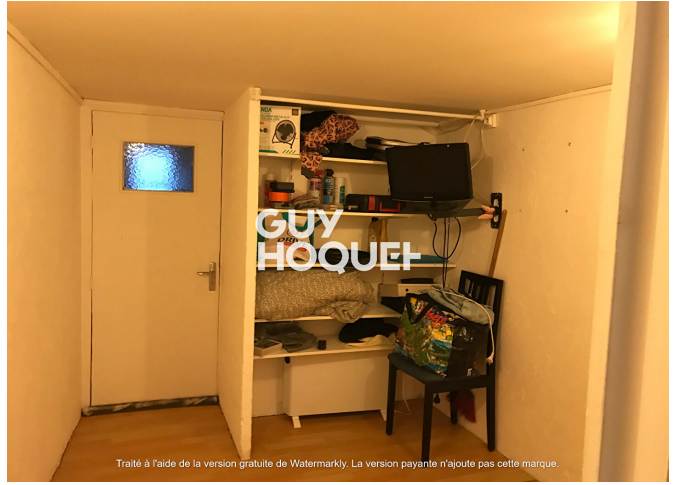
Traité à l'aide de la version gratuite de Watermarkly. La version payante n'ajoute pas cette marque.