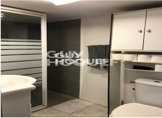
Traité à l'aide de la version gratuite de Watermarkly. La version payante n'ajoute pas cette marque.