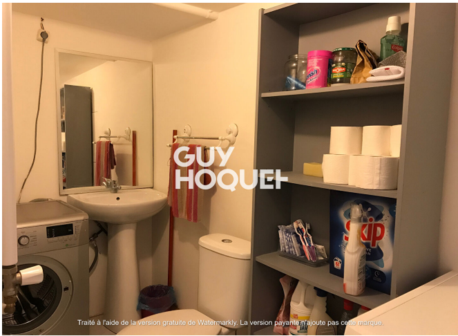
Traité à l'aide de la version gratuite de Watermarkly. La version payante n'ajoute pas cette marque.